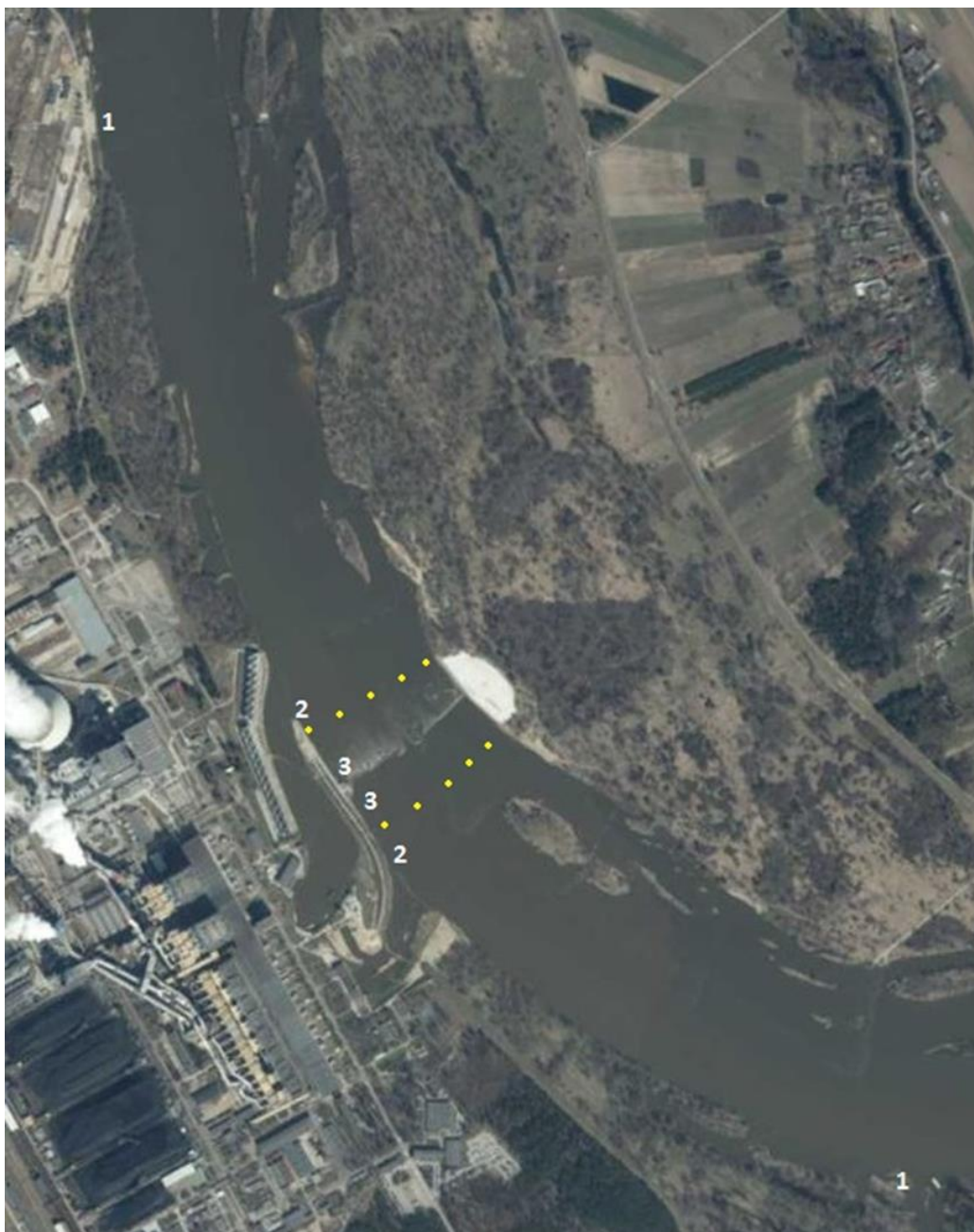
Fot. 2 Fotografia obrazująca sytuację nawigacyjną w okolicach progu w Świerżach Górnych