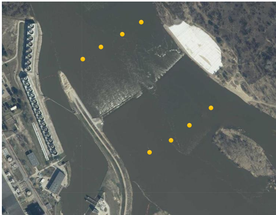
Fot. 1 Fotografia obrazująca położenie progu podpiętrzającego

Próg podpiętrzający Wisłę znajduje się na 425,95 km jej drogi żeglownej, w okolicy miejscowości Świerże Górne , ma charakter tymczasowy i służy zapewnieniu ciągłości zaopatrzenia Elektrowni Kozienice w wodę. Szlak wodny Wisły w tym miejscu jest zamknięty.